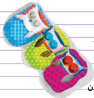
صبح، پیش دوست‌هایم خوابیدن