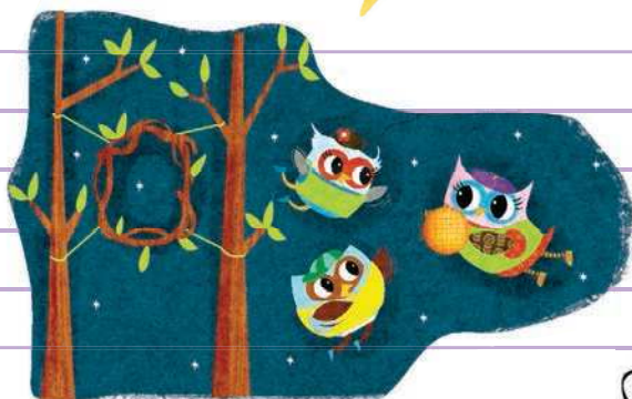
وینگبال بازی ۱