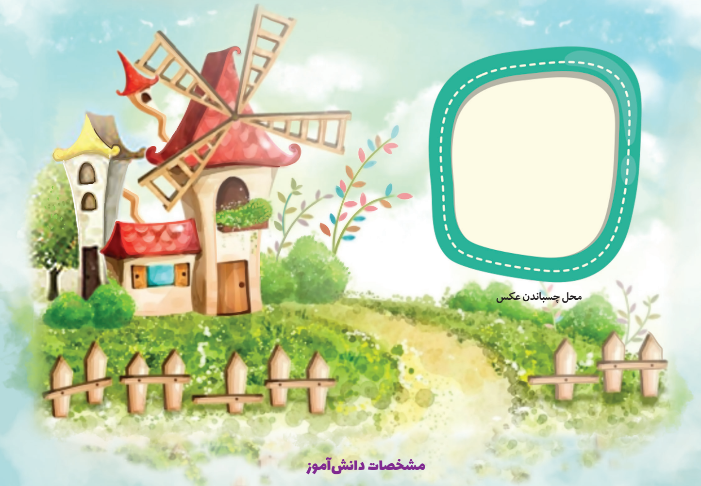
محل چسباندن عکس