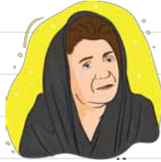
رقص باد، خنده‌ی گل