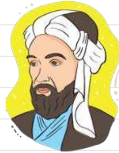
ای همه هستی ز تو پیدا شده (ستایش)