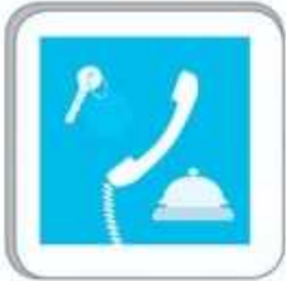
book a hotel

board a plane - weigh the baggage - check the timetable - take off - check out talk to the receptionist - baggage reclaim- land - pack for a trip- buy a ticket check in- exchange money - fill out the form - airport- book a hotel- check the passport