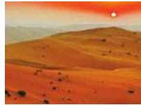
بیابان ربع الخالی، عربستان

نکته بیابان بزرگ عربستان، ربع الخالی در شبه جزیره عربستان حدود ۶۴۰۰۰۰ کیلومتر مربع یعنی تقریباً ۲/۵ برابر کشور انگلستان، وسعت دارد.