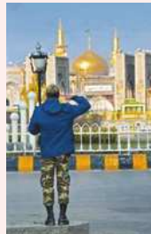
انسان‌ها در انجام کنش، به معنای آن توجه دارند.