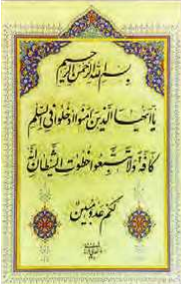
سوره بقره آیه ۲۰۸

هر فردی که قرآن کریم را بخواند و بتواند کلمات قرآن را برای خود ترجمه کند، معانی آیات را متوجه می‌شود، ولی بعضی از آیات را افراد متخصص در قرآن باید توضیح بیشتری بدهند تا ابعاد مختلف آن بیشتر معلوم شود. به کتاب‌هایی که آیات قرآن را ترجمه کرده و درباره آن توضیحات بیشتری مانند، دلائل نزول آن آیه یا سوره، زمان نزول و معانی و مقصود آیات با توجه به سایر آیات و سخنان پیشوایان دین آورده‌اند، کتاب تفسیر قرآن گفته می‌شود. در جهان اسلام تاکنون برای قرآن حدود پانصد تفسیر نوشته شده است که برخی از آن تفاسیر به بیست الی سی جلد می‌رسد. یکی از تفاسیر بسیار خوب، تفسیر نمونه نام دارد که با همکاری جمعی از دانشمندان و زیر نظر آیت الله مکارم شیرازی در ۲۷ جلد تألیف شده است.