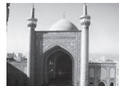
مسجد گهر شاد - مشهد