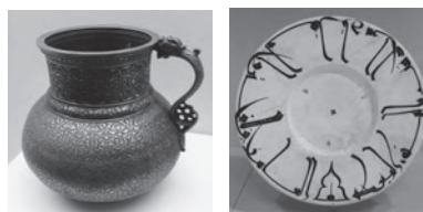
ظرف برنجی دوره تیموریان