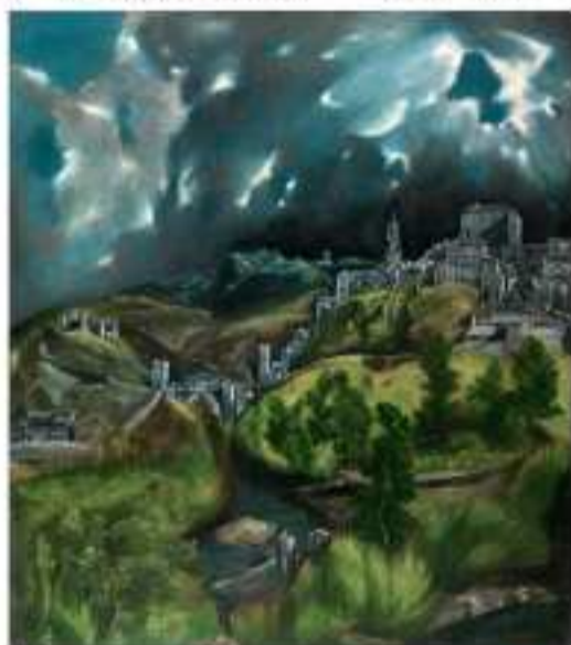
طراحی ۱ - صفحه ۳۲

منظره‌های ال گرکو، با نگرشی منحصر به فرد و با طرح‌بندی اطوار گرایانه و نقطه دید از بالا (در چشم‌انداز تولدو) نشانگر روح پرتلاطم و وهم‌انگیز طبیعت است.