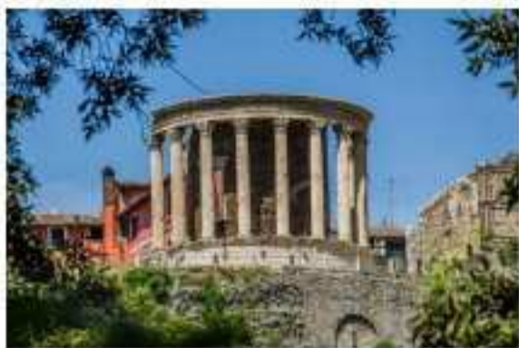
کارگاه نقاشی - صفحه ۵۱